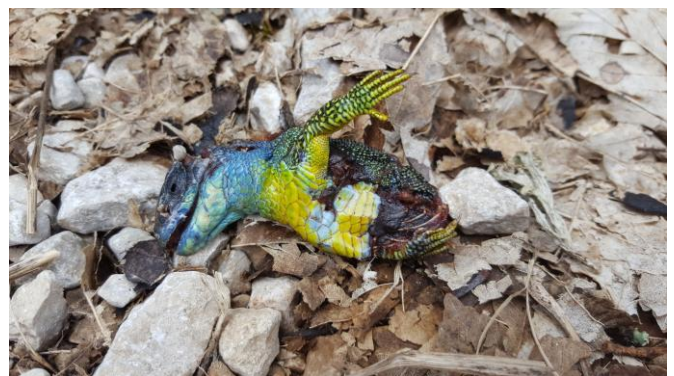
Lézard à Combe male

Ce stage s'est conclu autour de terriers de blaireaux.