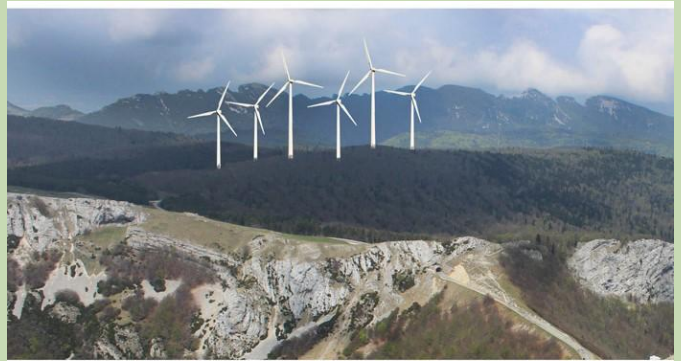
UN PARC ÉOLIEN INDUSTRIEL SUR LE COL DE LA BATAILLE EST INCOMPATIBLE AVEC L'INTÉGRITÉ DE CE LIEU À HAUTE VALEUR PATRIMONIALE ET ÉCOLOGIQUE

Les associations présentes ont rappelé tous les enjeux sur la biodiversité, mais quelques professionnels du tourisme nature ont, à leur tour, exprimé leur inquiétude sur l'aspect des paysages si exceptionnels du Parc Naturel Régional du Vercors. Pour eux, les touristes viennent se ressourcer dans ces montagnes et ne sont pas prêts à accepter la vision d'un parc éolien industriel. L'économie de ces professionnels est en jeu.