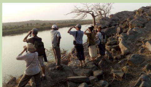
balade sur l'île du Lamantin