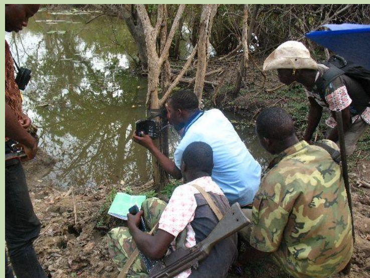
Récolte des données photos

L'objectif de recherche global des deux stages porte sur une analyse des fonctionnalités et attractivité des mares de la partie burkinabé du PN W par rapport à la faune en saison sèche. Ainsi, un stagiaire doit réaliser un inventaire et une caractérisation des mares en saison sèche qui permet d'établir une typologie des mares. L'autre stagiaire doit, à l'aide de campagnes de piégeage photo, analyser la fréquentation des mares par la faune. Le but étant de pouvoir évaluer l'attractivité des mares en fonction de leur typologie (et préconiser des axes de réflexion sur la gestion et/ou l'aménagement des mares pour améliorer leur attractivité/fonctionnalité vis-à-vis de la faune).