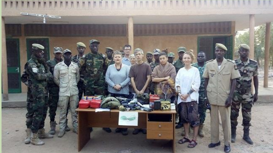
Equipe de la Tapoa et Equipe Mille Traces

Arrivés à Niamey, notre périple se répartira en 3 lieux successifs : Centre Forestier de La Tapoa (W/Niger) entrée du parc, le Point Triple, lieu central à la frontière entre Niger Burkina et Benin, les chutes de Koudou (Bénin) site dominant la rivière Mékrou, permettant une observation continue des animaux.