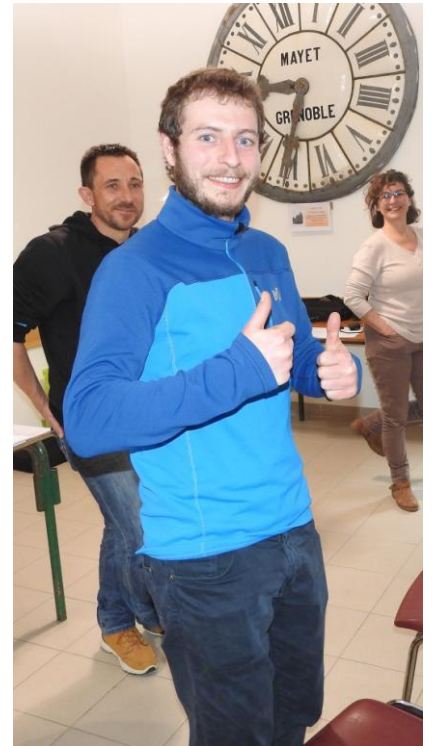
L'équipe Mille Traces