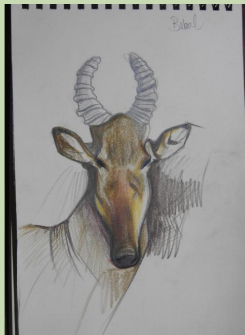
Bubale - dessin de Aude