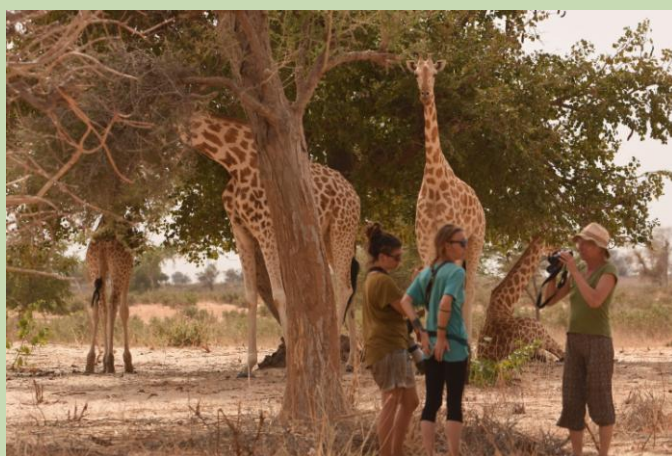
Dernières girafes d'Afrique de l'Ouest